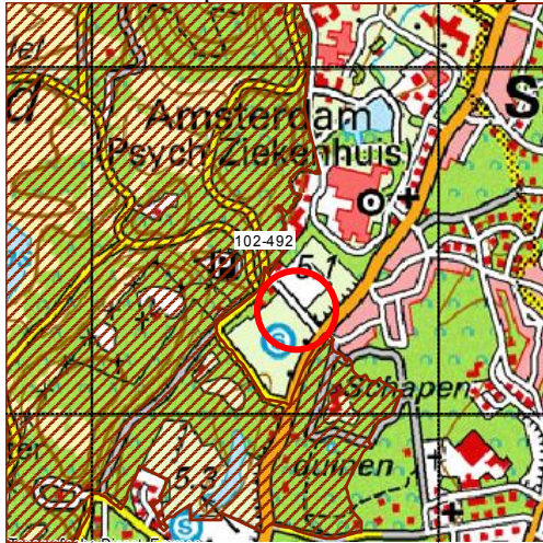
Figuur 2: de ligging van het perceel ten opzichte van Habitatrichtlijngebied Zuid-Kennemerland.

Het plangebied is gelegen buiten het habitatrichtlijngebied Zuid-Kennemerland. Er zijn als gevolg van de herinrichting met betrekking tot het plangebied geen effecten te verwachten op het habitatrichtlijngebied.