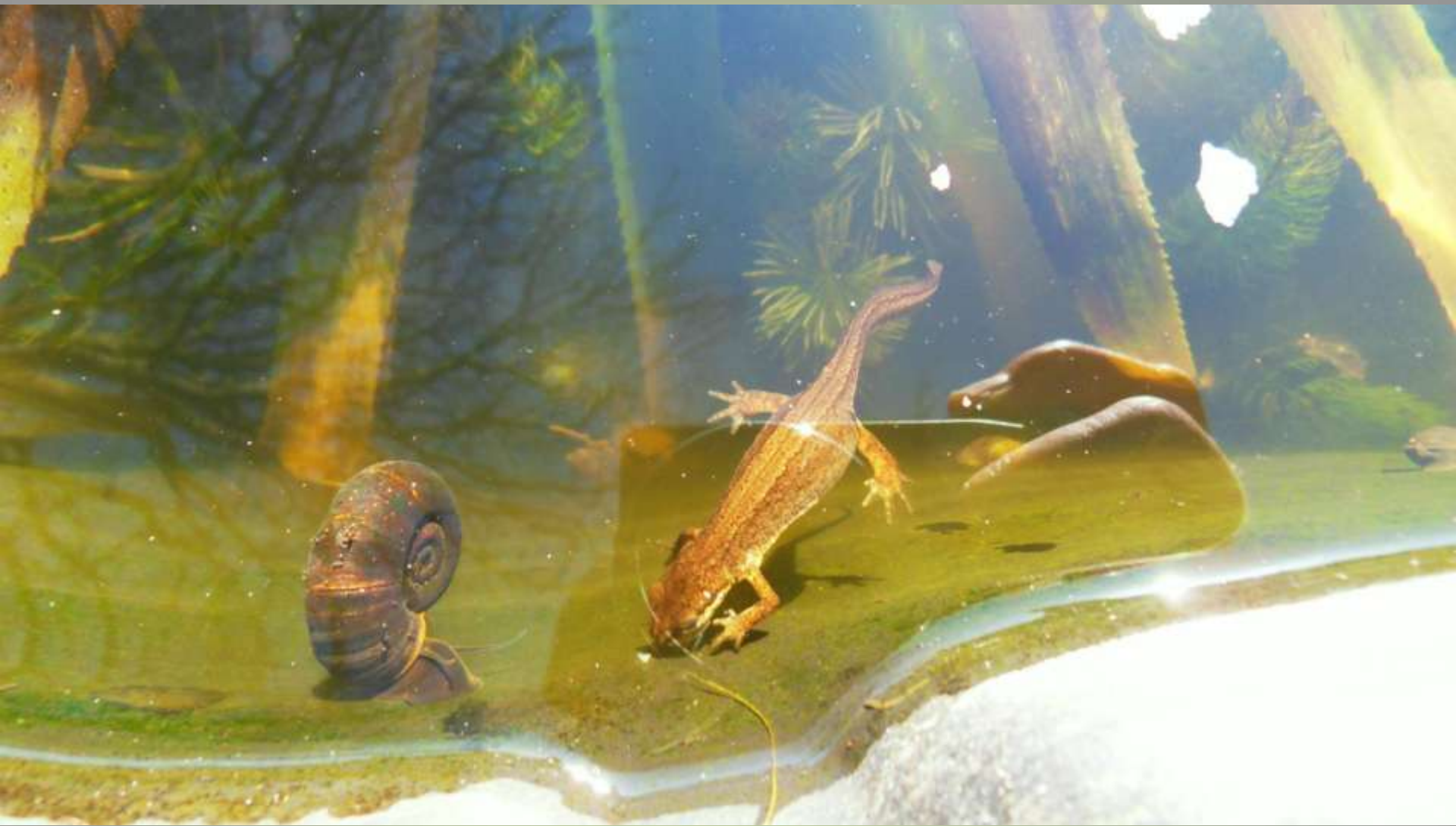
Kleine watersalamander (in de vijver)